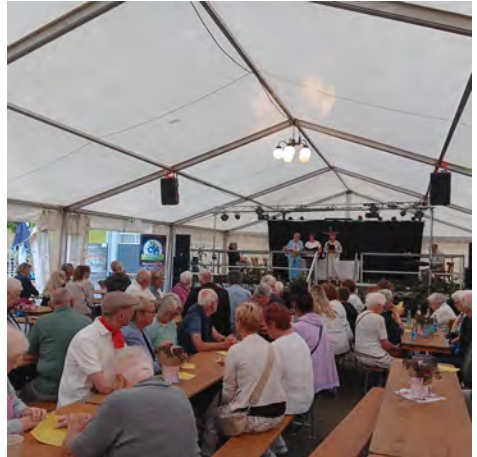
Gottesdienst auf Heidelbeerkirmes