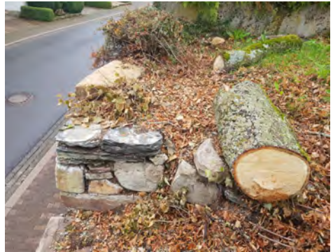
Stützmauer in Hottenbach

Die Presbyterien haben sich im Berichtsjahr monatlich getroffen. Das Leitungsorgan der Kirchengemeinde Hottenbach-Stipshausen ist stark beschäftigt mit der Sanierung der denkmalgeschützten Kirchhofmauer in Hottenbach. Die Trockenlegung der Kirche in Stipshausen konnte erfolgreich abgeschlossen werden. In der Kirchengemeinde Rhaunen-Hausen-Sulzbach hat das Presbyterium häufig über die Fortführung der Kindergartenarbeit beraten.