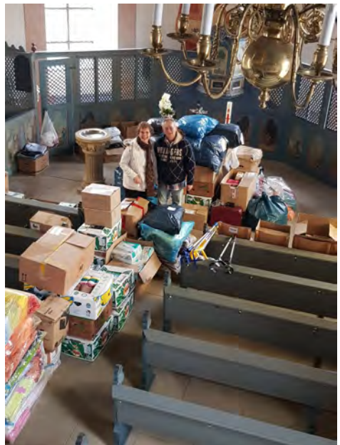
Ukraine-Aktion in Stipshausen

hausen aufgebaut waren. Im Advent 2024 gab es an der Krippe in Stipshausen wieder eine ökumenische Begegnung. Der Erlös ging an einen Förderverein für krebskranke Kinder in Trier. In Hausen fand zu Weihnachten 2024 wieder eine Wunschsternaktion statt. Sie war in diesem Jahr für das Tierheim in Kirn bestimmt